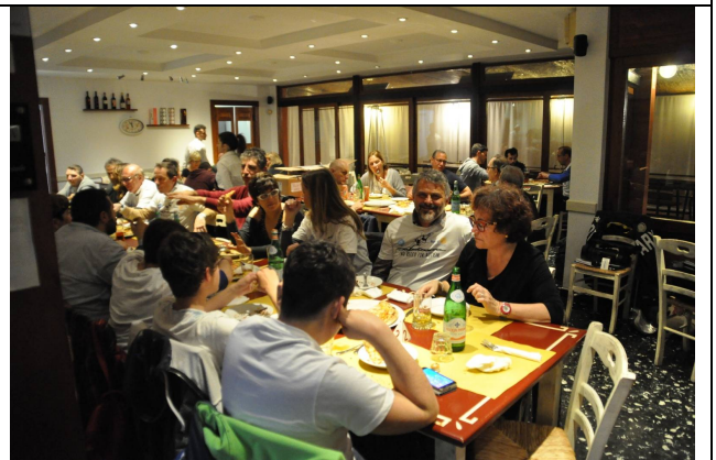
La serata si conclude con una piacevole cena insieme agli amici di ANGSA