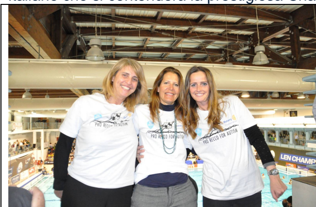
Nella piscina di Sori con indosso la maglietta dell' iniziativa

Sport ad altissimo livello e solidarietà, non ci poteva essere occasione migliore per il lancio dell' iniziativa Pro Recco e Rotary for Autism. Pro Recco e Brescia si sono affrontate in una splendida partita valida per la fase a gironi della Champions. Netta la vittoria della Pro Recco, ma grande soddisfazione per il passaggio del turno anche della formazione Bresciana che andrà a costituire, insieme alla Sport Management il terzetto di squadre italiane che si contenderà la prestigiosa Champions League nella final eight di Hannover.