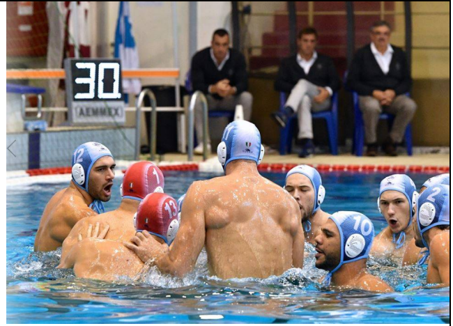
...inizia la partita!