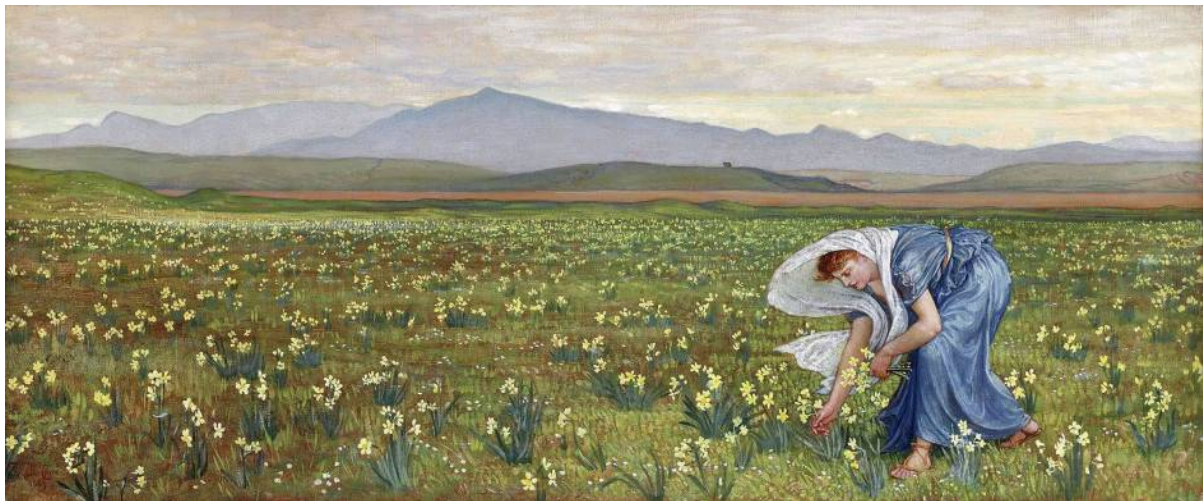
Walter T. Crane, La primavera, 1883

I pittori ne hanno tratto spunto per capolavori immortali: