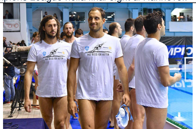
La Pro Recco entra in vasca con la maglietta Pro Recco e Rotary for Autism