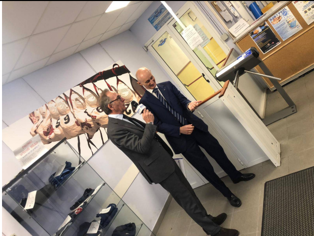
L' iniziativa ha avuto ampia diffusione mediatica grazie all' amico Beppe Nuti